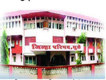
महिन्यापासून निवडणुकांची आचार संहिता सुरू असल्याने लिफ्ट सुरू करण्याचा विषय मागे पडला. त्यानंतर सप्टेंबर महिन्यात लिफ्ट सुरू करण्याचा मुहुर्त काढण्यात आला. मोठा गाजवाजा करत १३ सप्टेंबर उद्घाटनाचा समारंभ देखील पार पडला. परंतु, केवळ फोटो सेशन करण्याइतकेच या समारंभाला महत्त्व लाभले होते. तेव्हापासून जिल्हा परिषदेत लावलेली लिफ्ट बंदच आहे. जिल्हा परिषदेच्या मुख्य प्रशासकीय इमारतीला तळमजल्यासह पहिला आणि दुसरा असे तीन मजले असून चौथ्या मजल्यावर

धुळे-जिल्हा परिषदेत मोठ्या प्रतीक्षेनंतर लिफ्ट बसविण्यात आल्यानंतर सप्टेंबर महिन्यात मोठ्या थाटात उद्घाटनाचा समारंभ देखील पार पडला; तरी आजही बहुप्रतिक्षित लिफ्ट बंदच असून जिल्हा परिषदेत कामनिमित्त येणाऱ्या दिव्यांग अभ्यागतांना दोन मजले चढून समाज कल्याण विभागात जावे लागत असल्याने त्यांचे मात्र हाल होत आहेत. जिल्हा परिषदेच्या मुख्य इमारतीत बऱ्याच वर्षांच्या प्रदीर्घ प्रतीक्षेनंतर लिफ्ट बसविण्यात आली; पण सध्या स्थितीत ही लिफ्ट बंद असल्याने दिव्यांग नागरिकांचे हाल होत आहेत. फेब्रुवारी २०२४ मध्ये लिफ्टच्या कामाला सुरुवात करण्यात आली होती. एप्रिल २०२४ महिन्यापर्यंत लिफ्टचे संपूर्ण काम पूर्ण झाले. मात्र लिफ्टसाठी स्वतंत्र वीज मीटर घ्यावे लागत असल्याने वीज मंडळाकडे प्रस्ताव पाठवला होता. त्यातच मे