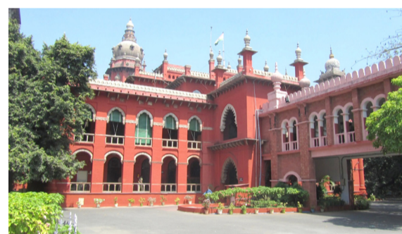
त्यामुळे त्याला कोणत्याही एका धर्माच्या चौकटीत मर्यादित ठेवता येणार नाही, असे मद्रास उच्च न्यायालयाने म्हटलं आहे.

मद्रास उच्च न्यायालयाने नुकताच एक महत्त्वाचा निर्णय दिला आहे. भगवद् गीता, वेदांत, योगा धार्मिक नसल्याचा निर्णय मद्रास उच्च न्यायालयाने दिला आहे. या संदर्भातील केंद्रीय गृह मंत्रालयाचा आदेश देखील मद्रास उच्च न्यायालयाने रद्द केला आहे. 'भगवद् गीता हे धार्मिक ग्रंथ नाही, तर ते एक नैतिक शास्त्र आहे. भारतीय संस्कृतीचा हा एक भाग आहे.