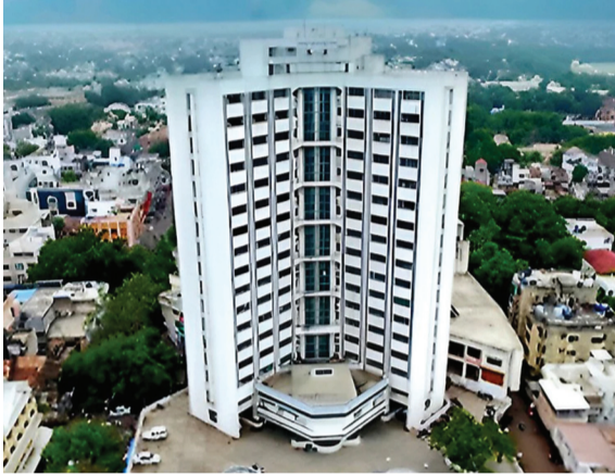
पहिल्याच दिवशी ७७७ अर्जांची विक्री

मतदान पार पडणार आहे, तर १६ जानेवारीला निवडणुकीचा निकाल जाहीर होणार आहे. महापालिकेच्या निवडणूक कार्यक्रम जाहीर करण्यात आला आहे. ज्यामध्ये जळगाव महापालिकेचाही समावेश आहे. १५ जानेवारीला महापालिकेसाठी