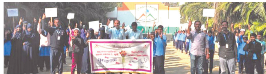
प्रतिनिधी । धुळे

महानगरपालिका निवडणुकीत मतदानाचा टक्का वाढावा, लोकशाही अधिक बळकट करण्याच्या उद्देशाने धुळे शहरातील विविध शाळांमधील विद्यार्थ्यांच्या माध्यमातून मतदान जनजागृती रॅली काढण्यात आली. या रॅलीत विद्यार्थ्यांनी 'मतदानासाठी वेळ काढा, जबाबदारी आपली पार पाडा'