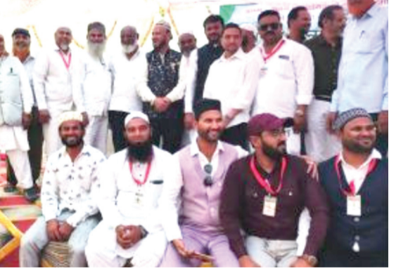
प्रतिनिधी । शहादा