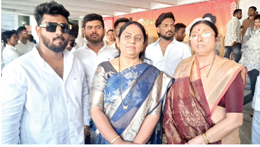
प्रतिनिधी | जळगाव