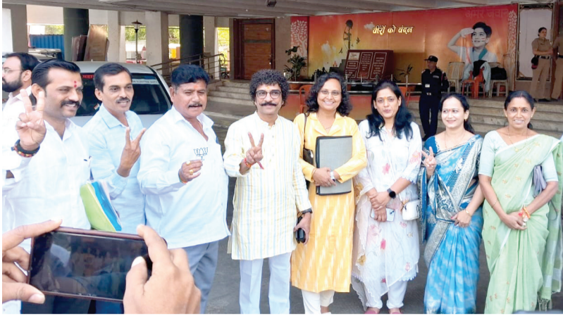
प्रतिनिधी । जळगाव

महायुतीच्या यादीने उडवला राजकीय गोंधळ; निष्ठावंतांची नाराजी : नेत्यांकडून मनधरणीचे प्रयत्न