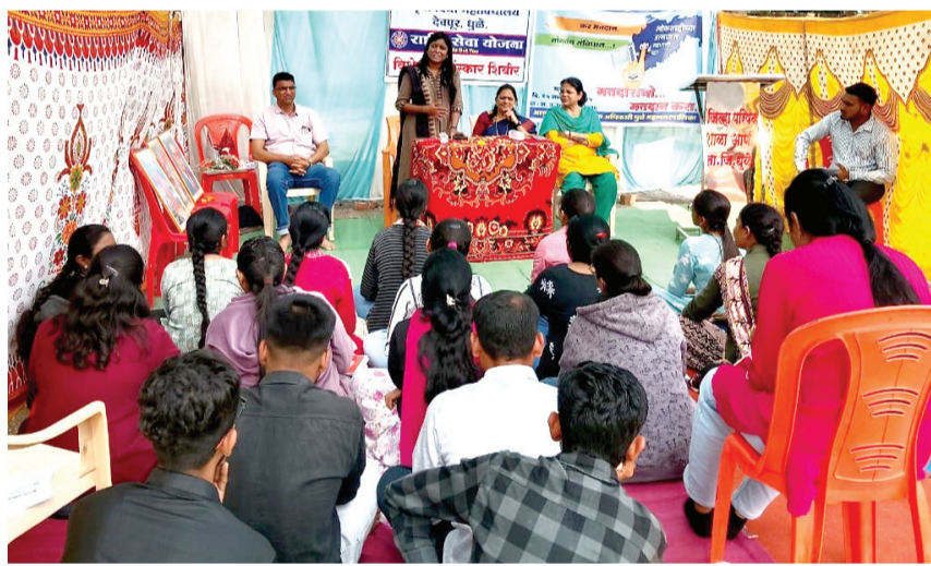
प्रतिनिधी | धुळे

येथील महानगरपालिकेची सार्वत्रिक निवडणुकीत समाजातील सर्व स्तरातील नागरिकांनी मतदानाचा हक्क बजावावा, यासाठी आज डॉ. बाबासाहेब आंबेडकर स्मृती विधी लॉ कॉलेज येथे युवकांसाठी विशेष जनजागृती कार्यक्रम आयोजित करण्यात आला होता. महिला, युवक व दिव्यांग मतदारांनी १०० टक्के मतदान करावे, या उद्देशाने महापालिकेच्या वतीने विविध ठिकाणी मतदान जनजागृती कार्यक्रम राबविण्यात येत आहेत.