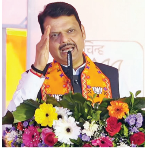
प्रतिनिधी | धुळे

⇒ विरोधकांना मिरची लागली तर आम्ही काय करू? : मुख्यमंत्री देवेंद्र फडणवीस