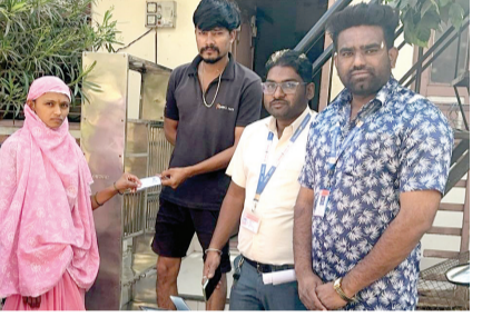
माहिती मिळावी तसेच मतदान प्रक्रिया सुलभ व्हावी या उद्देशाने महानगरपालिकेमार्फत मतदार स्लिप (वोटर स्लीप) घोष्यी वाटप करण्यासाठी कर्मचारी पथकाची नियुक्ती करण्यात आलेली आहे. यात वसुली विभागातील १९ लिपीक तसेच स्वच्छता विभागातील प्रभागातील एकूण ३० मुकादम तसेच सुमारे १३० अशा वर्कर यांची नियुक्ती करण्यात आलेली आहे. यांच्या

धुळे महानगरपालिका सार्वत्रिक निवडणुकीची प्रक्रिया अंतिम टप्प्यात आलेली असून धुळे महानगरपालिकेमार्फत प्रभाग निहाय वोटर स्लीप वाटप आयुक्त तथा निवडणूक अधिकारी यांच्या मार्गदर्शनाखाली सुरु झाली आहे. धुळे महानगरपालिका सार्वत्रिक निवडणूक २०२५-२६ च्या अनुषंगाने शहरातील प्रत्येक मतदाराला आपले मतदान केंद्र व मतदान कक्ष बुध याबाबत अचूक