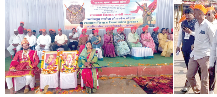
राजमाता जिजाऊ जयंती साजरा