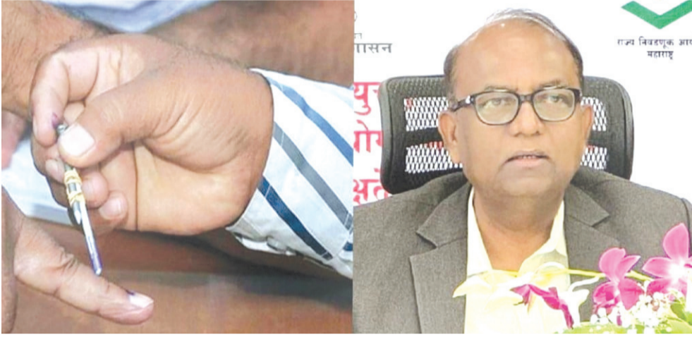
वृत्तसंस्था | मुंबई

५० टक्क्यांपेक्षा कमी आरक्षण असलेल्या जिल्हा परिषदांच्याच निवडणुका