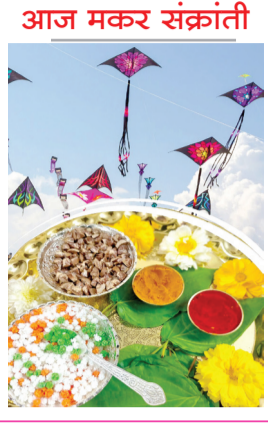
आज मकर संक्रांती