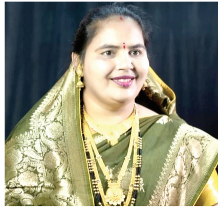
लागणार आहे. हे धुरंधर दाम्पत्य आता नव्या जोमाने उरल्या सूरल्या कामांचा धडाका लावतीलच या