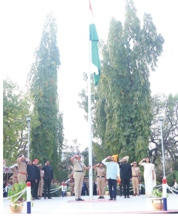
प्रतिनिधी | जळगाव

जिल्हाधीन शेतकरी, कष्टकरी, महिला, युवक, आदिवासी गोंगराव, कामगार, ज्येष्ठ नागरिक या सर्व घटकांचा सन्मान राखत त्यांना पुढे नेण्याचा आमचा संकल्प असून जळगाव जिल्हाच्या सर्वांगीण विकासासाठी शासन कटिबद्ध आहे, असे प्रतिपादन राज्याचे स्वच्छता व पाणी पुरवठामंत्री तथा जिल्हाचे पालकमंत्री गुलाबराव पाटील यांनी केले.