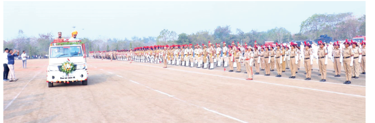
असून १ हजार ८० गावे घर जल घोषित झाली आहेत.

जिल्हाला औद्योगिकदृष्ट्या 'डी-प्लस' दर्जा प्राप्त झाल्यामुळे येथे नव्या उद्योगांना मोठ्या