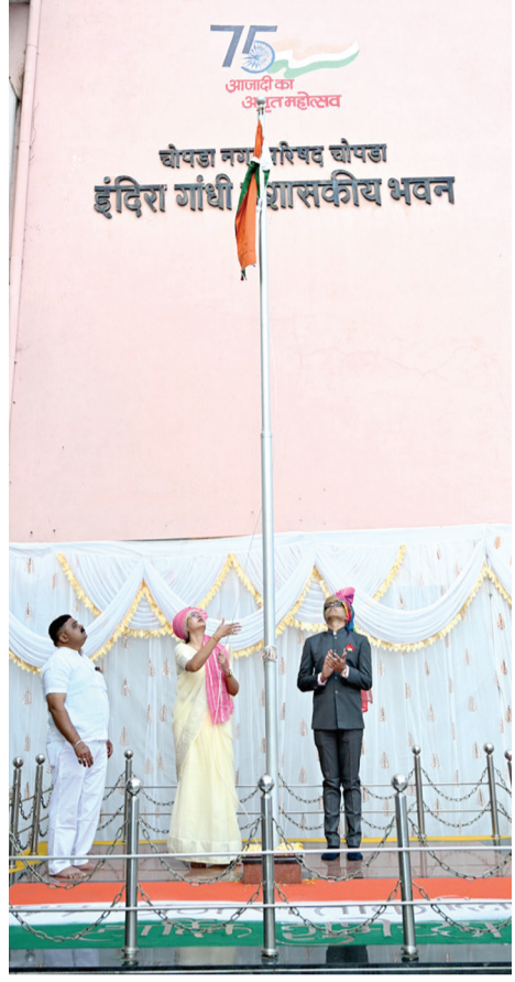
प्रतिनिधी | जळगाव चम्पू

जिल्हाभरातील शासकीय तसेच खासगी शाळा महाविद्यालयात सोमवार दि. २६ जानेवारी रोजी ७७ व्या प्रजासत्ताकदिनानिमित्त ध्वजारोहणाचा कार्यक्रम उत्साहात साजरा करण्यात आला. यावेळी मान्यवरांसह, मुख्याध्यापक, शिक्षक, शिक्षिकेतर कर्मचाऱ्यांसह विद्यार्थी उपस्थित होते.