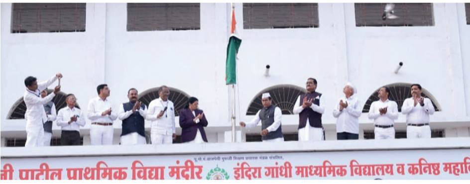
श्री पाटील प्राथमिक विद्या मंदिर | इंदिरा गांधी माध्यमिक विद्यालय व कनिष्ठ महाविद्यालय

चोपडा - येथील ज्येष्ठ नागरिक संघात २६ जानेवारी सोमवार रोजी सकाळी ८:१५ वाजता