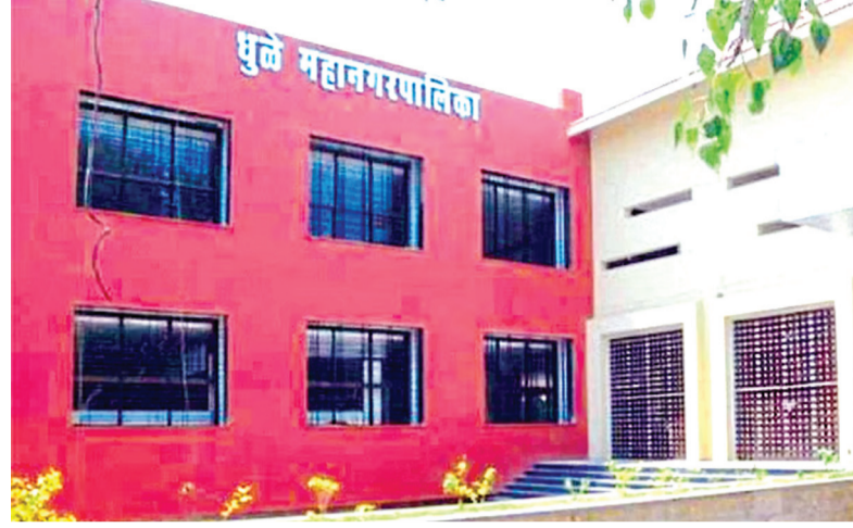
प्रतिनिधी । धुळे