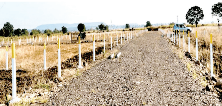
प्रतिनिधी । जळगाव

राज्य सरकारने विकास आराखडा (डीपी) अथवा प्रादेशिक विकास आराखडा (आरपी) लागू असलेल्या