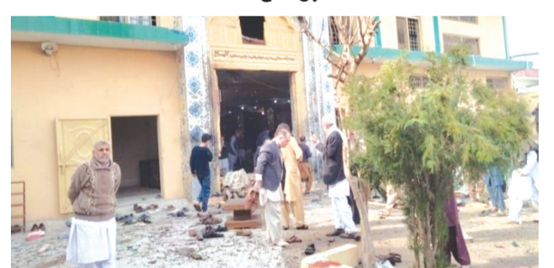
वृत्तसंस्था । कराची

पाकिस्तानची राजधानी इस्लामाबाद शुक्रवारी दुपारी भीषण बॉम्बस्फोटाने हादरली. तरलाई भागातील एका इमामवाड्यामध्ये जुमेच्या नमाजदरम्यान झालेल्या या स्फोटात ३१ जणांचा मृत्यू आणि १६९ हून अधिक लोक जखमी झाले आहेत. मृतांचा आकडा वाढण्याची भीती व्यक्त करण्यात येत आहे.