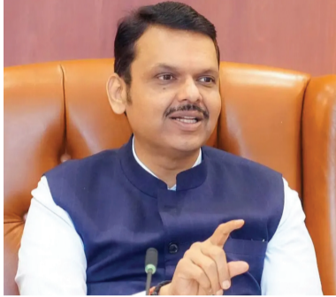
वृत्तसंस्था । नागपूर

महिंद्रा अॅन्ड महिंद्रा कंपनी ईव्ही निर्मितीसह ऑटोमोबाईल क्षेत्रातील एकात्मिक (इंटीग्रेटेड) प्रकल्पासाठी १५ हजार कोटी रुपयांची गुंतवणूक करणार आहे. याबाबतचा सामंजस्य करार आज झाला. या प्रकल्पातून २०२८ पर्यंत वाहन उत्पादन सुरु करण्याचे नियोजन आहे. नागपूरसह छत्रपती संभाजीनगर आणि नाशिक येथेही हे प्रकल्प उभारले जाणार आहे, अशी घोषणा मुख्यमंत्री देवेंद्र फडणवीस यांनी केली.