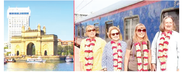
वृत्तसंस्था । नवी दिल्ली

जगभरातून भारतात येणाऱ्या विदेशी पर्यटकांसाठी आपला महाराष्ट्र हे देशातील सर्वाधिक पसंतीचे राज्य ठरत आहे. गेल्या तीन वर्षांत राज्यात येणाऱ्या परदेशी पर्यटकांच्या संख्येत दुपटीहून अधिक वाढ झाली आहे.