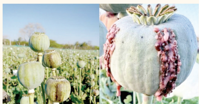
देशाच्या बहुतेक भागात अफूच्या शेतीवर बंदी आहे. पण, राजस्थानच्या चित्तोडगड भागात पूर्व परवानगी घेऊन, पोलिसांच्या नियंत्रणाखाली अफूची

नशाखोर व्यक्तींमुळे, नशाबाजांमुळे गडबड, गोंधळ, ताण-तणाव निर्माण झाल्याचे आपण सर्रास ऐकतो. पण, राजस्थानच्या शेतकऱ्यांसमोर मोठे संकट ओढावले आहे, ते अफूची बोंडे खाणाऱ्या पोपटांमुळे. अफूची लागवड केलेला शेतकरी कायम सतर्क असतोच. पण, पोपटांमुळे शेतकऱ्यांच्या चिंतेत भर पडली आहे. रात्र-दिवस शेतकऱ्यांना कडक पहारा द्यावा लागत आहे.