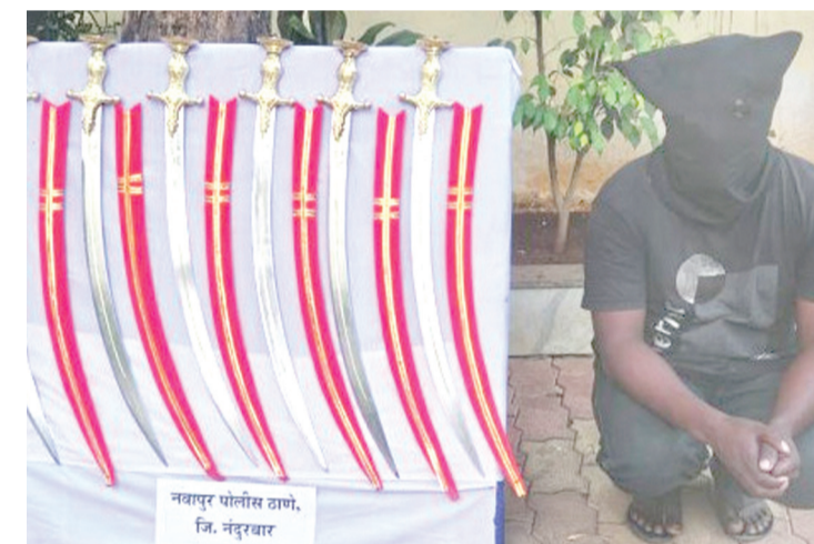
दि.५ रोजी दुपारी २.४० वाजेच्या सुमारास पोलिसांना मिळाली होती.

नवापूर शहरातील दिगंबर पाडवी सोसायटीकडे जाणाऱ्या सार्वजनिक रस्त्याच्या कडेला एक तरुण संशयास्पददरित्या तलवारींची विक्री करत असल्याची माहिती