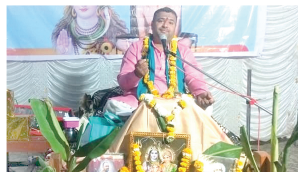
१४८ व्या प्रगत दिनानिमित्त इंद्रप्रस्थ नगरातील योगिराज श्री