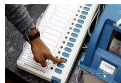
केंद्रात जावून मतदान करणे शक्य नसलेल्या मतदारांची संख्या २६८ एवढी आहे. या सर्व वृद्ध मतदारांच्या घरी जावून मतदान घेतले जाणार आहे. यासाठी धुळे शहर विधानसभा मतदार संघात १० नोव्हेंबरला सकाळी ८.०० ते सायंकाळी ६.०० वाजेपर्यंत ही प्रक्रिया राबवण्यात येईल. तर या तारखेस अनुपस्थित असलेल्या मतदारांसाठी १२ नोव्हेंबर रोजी मतदान घेतले जाणार आहेत. त्यासाठी १४ पथके