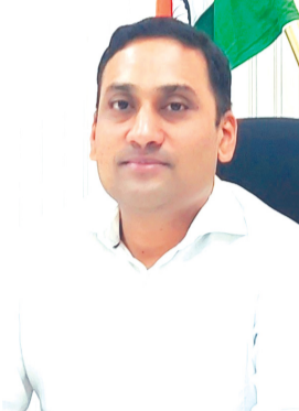
या घटकाचा उपयोग मतदार जनजागृतीसाठी करण्यात यावा. सोशल मीडियावर सक्रिय आणि लोकप्रिय असणाऱ्या घटकांची यासाठी मदत मतदार जनजागृती करण्यात येत आहे. प्रत्येक