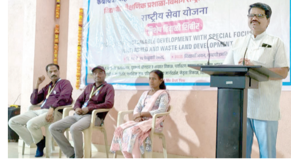
कवयित्री बहिणाबाई चौधरी उत्तर महाराष्ट्र विद्यापीठातील शैक्षणिक प्रशाळा-विभाग राष्ट्रीय सेवा योजना एकक यांच्यावतीने