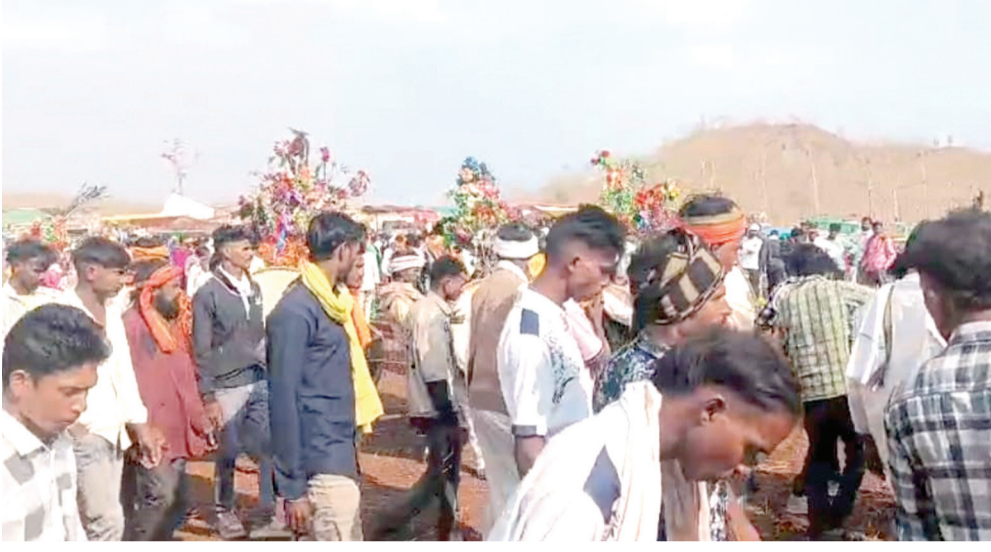
केले. टेबल ढोल गटात डेड्यापाडा पथकाने प्रथम क्रमांक पटकावत १० हजार रुपयांचे पारितोषिक मिळविले,