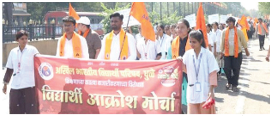
प्रतिनिधी | धुळे

उठ दोस्ता, उगार मूठ... तूच थांबव तुझ्या शिक्षणाची लूट ; जोरदार घोषणाबाजी