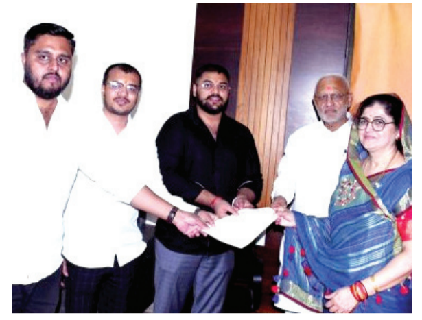
प्रतिनिधी | नंदुरबार