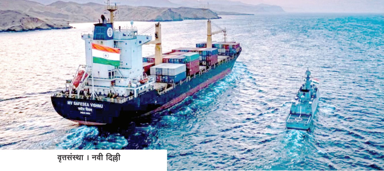
वृत्तसंस्था । नवी दिल्ली

सर्व जहाजांवर ७०० हून अधिक भारतीय खलाशी; ३ खलाशांचा मृत्यू