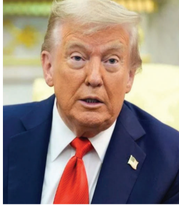
शिफारस करण्यात आली आहे.

अमेरिकेच्या आंतरराष्ट्रीय धार्मिक स्वातंत्र्य आयोगाने नुकतेच जारी केलेल्या रिपोर्टमध्ये म्हटले आहे की, धार्मिक स्वातंत्र्याच्या गंभीर उल्लंघनाची जबाबदारी आणि ते खपवून घेतल्याबद्दल या संस्थांवर निर्बंध लादले गेले पाहिजेत. या निर्बंधांमध्ये त्या व्यक्तींची किंवा संस्थांची मालमत्ता गोठवली जावी किंवा त्यांना अमेरिकेत प्रवेश करण्यास बंदी घातली जावी, अशी शिफारस करण्यात आली आहे.